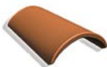
2 Коньковая черепица